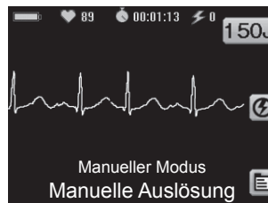
Bildschirm Manueller Modus

ENTLADEN: Bricht den Ladevorgang ab (mittlere Taste, nachdem ein Ladevorgang gestartet wurde).